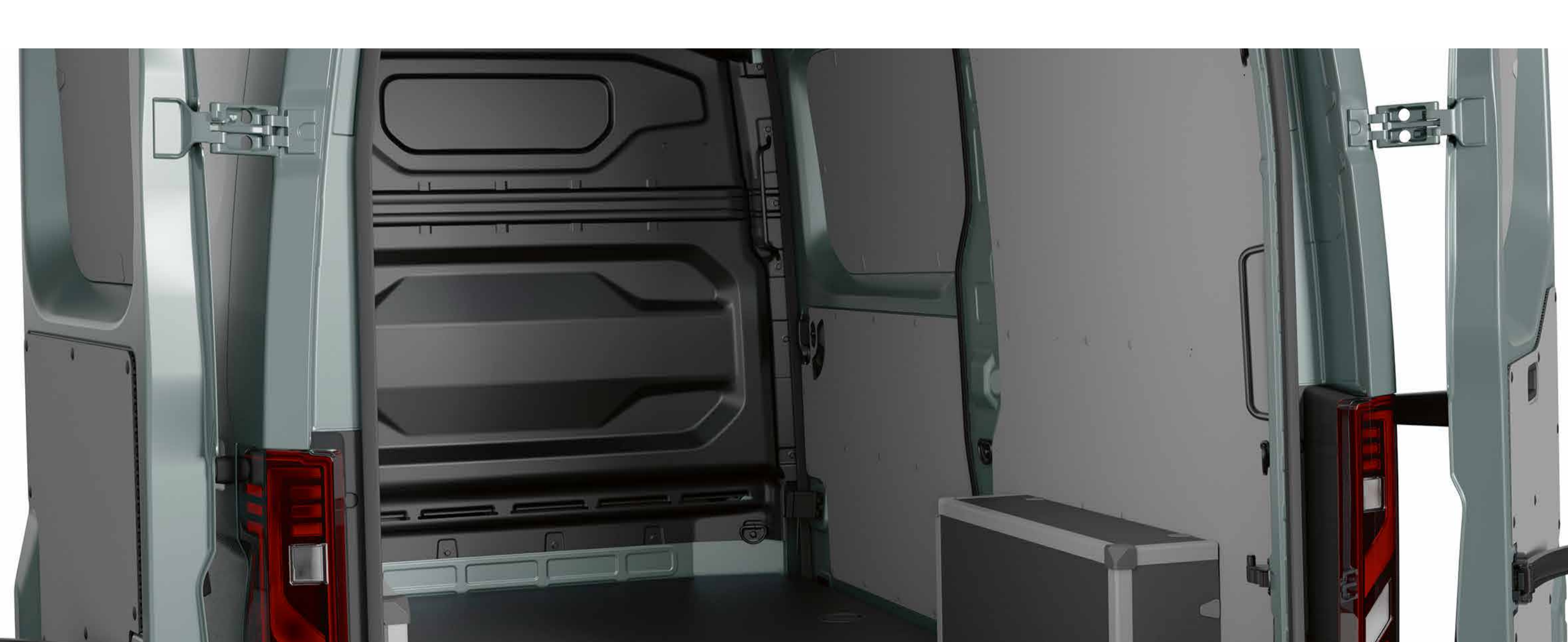
innovation polypropylene beklædning

Innovation finish: Vaskbart, fugtresistent og op til 65 % lettere end træ. Ideelt til at maksimere rækkevidden af et elektrisk køretøj.