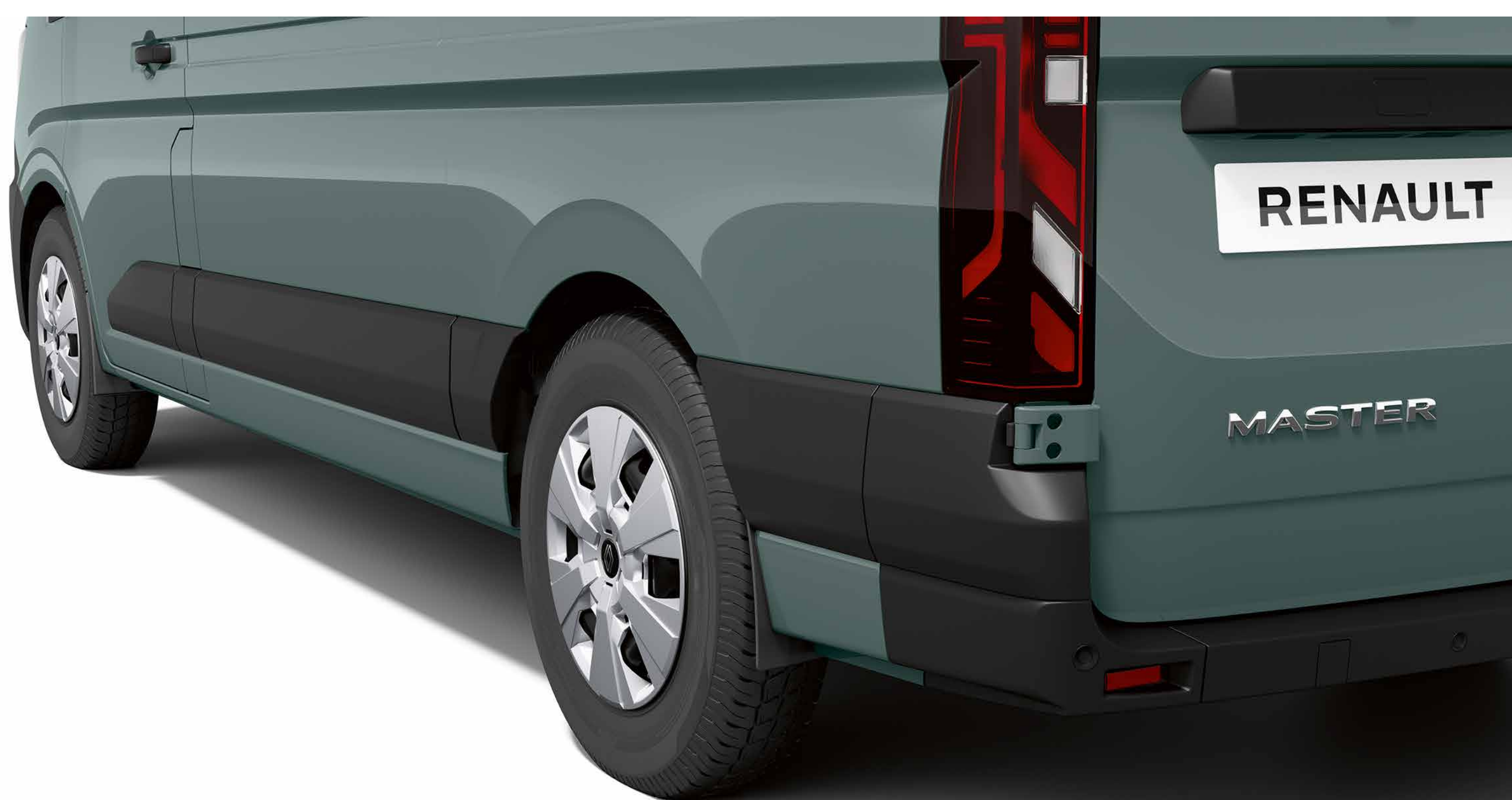
for- og bagstænklapper

Ved at installere stænklapper og/eller hjulkassebeskyttere kan du forhindre grus og mudder i at beskadige køretøjets undervogn.