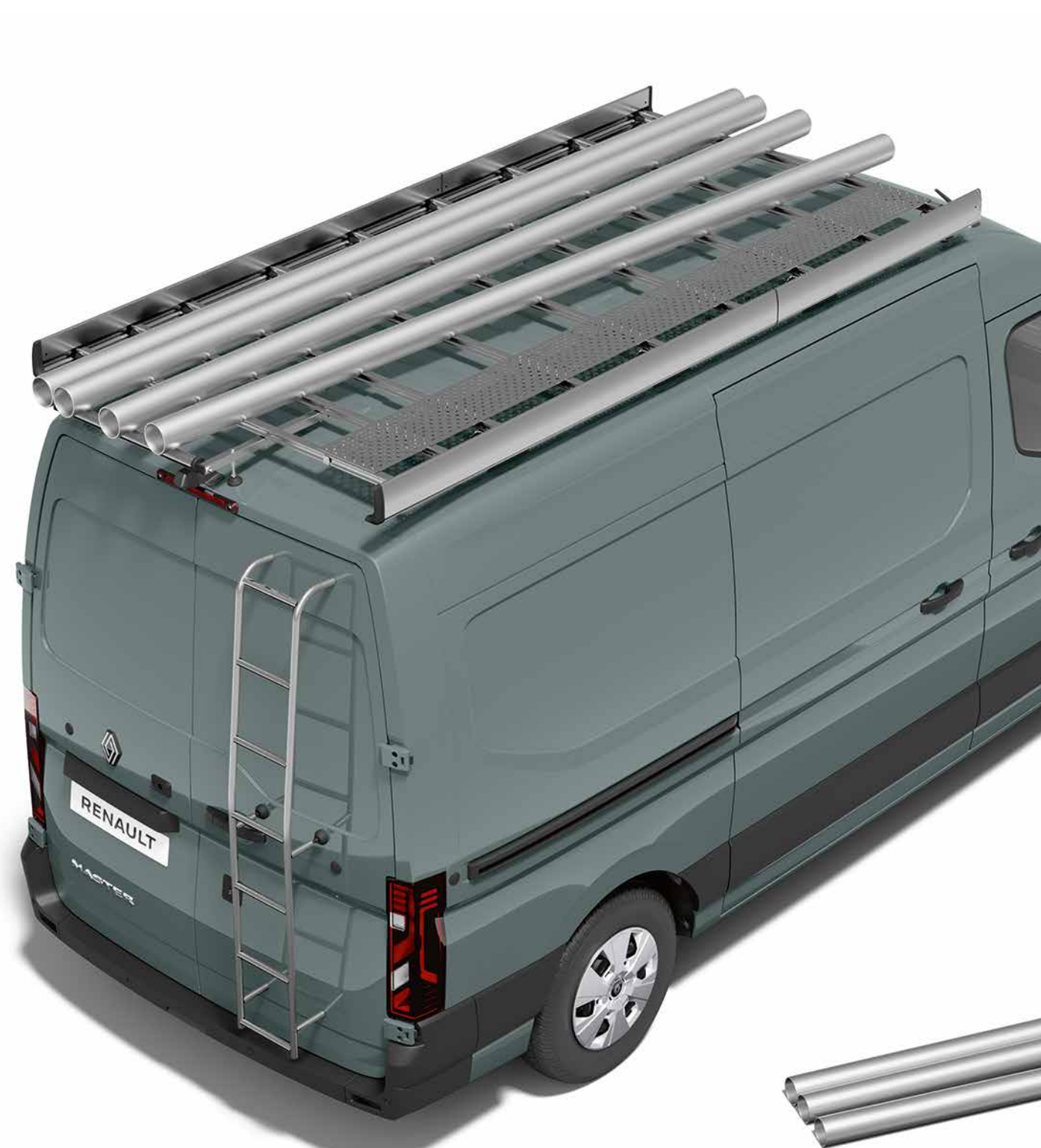
tagbøjle, gangbro og stige

Monter op til 5 tagbøjler (2) for at øge lastkapaciteten. Du kan transportere dit professionelle udstyr – som skiltesæt og stiger.