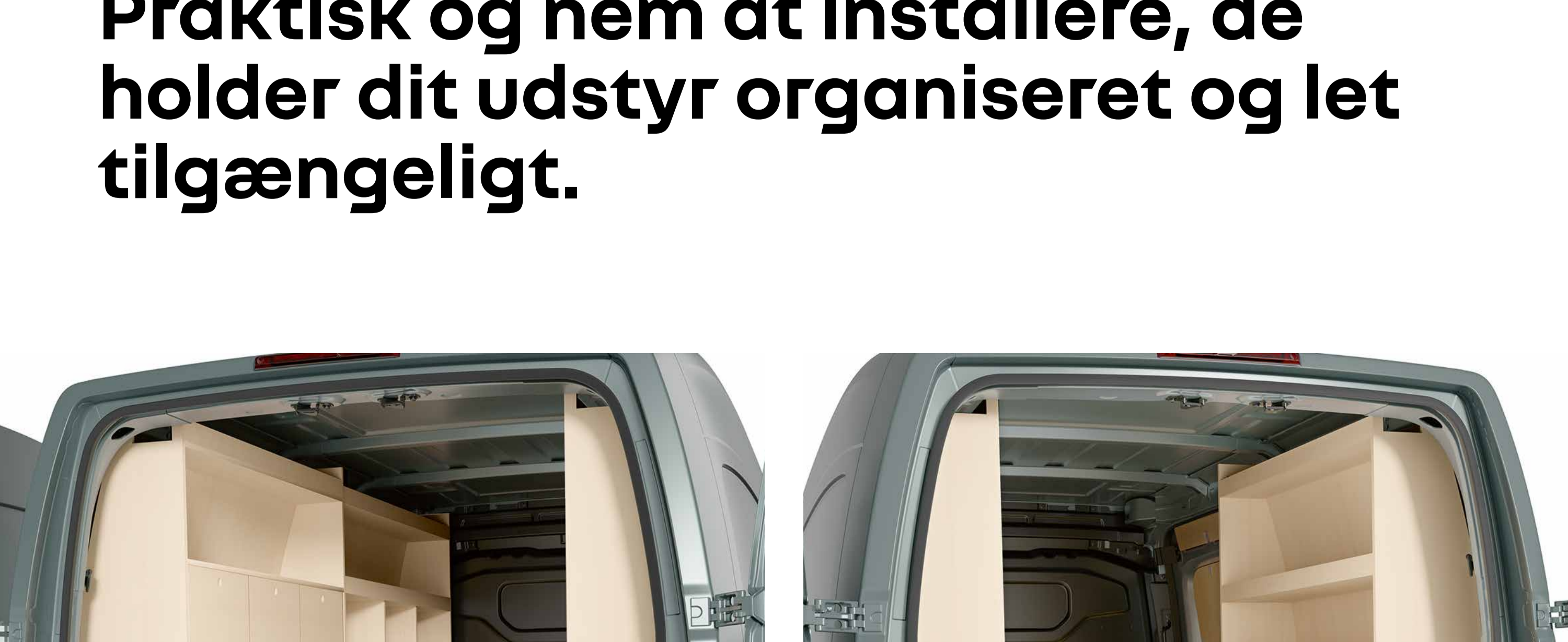
front- og venstre bagskabe med hylder, åbne rum og lukkede luger

Tilpas lastrummet med linjereoler og åbne eller lukkede skabe. Praktisk og nem at installere, de holder dit udstyr organiseret og let tilgængeligt.