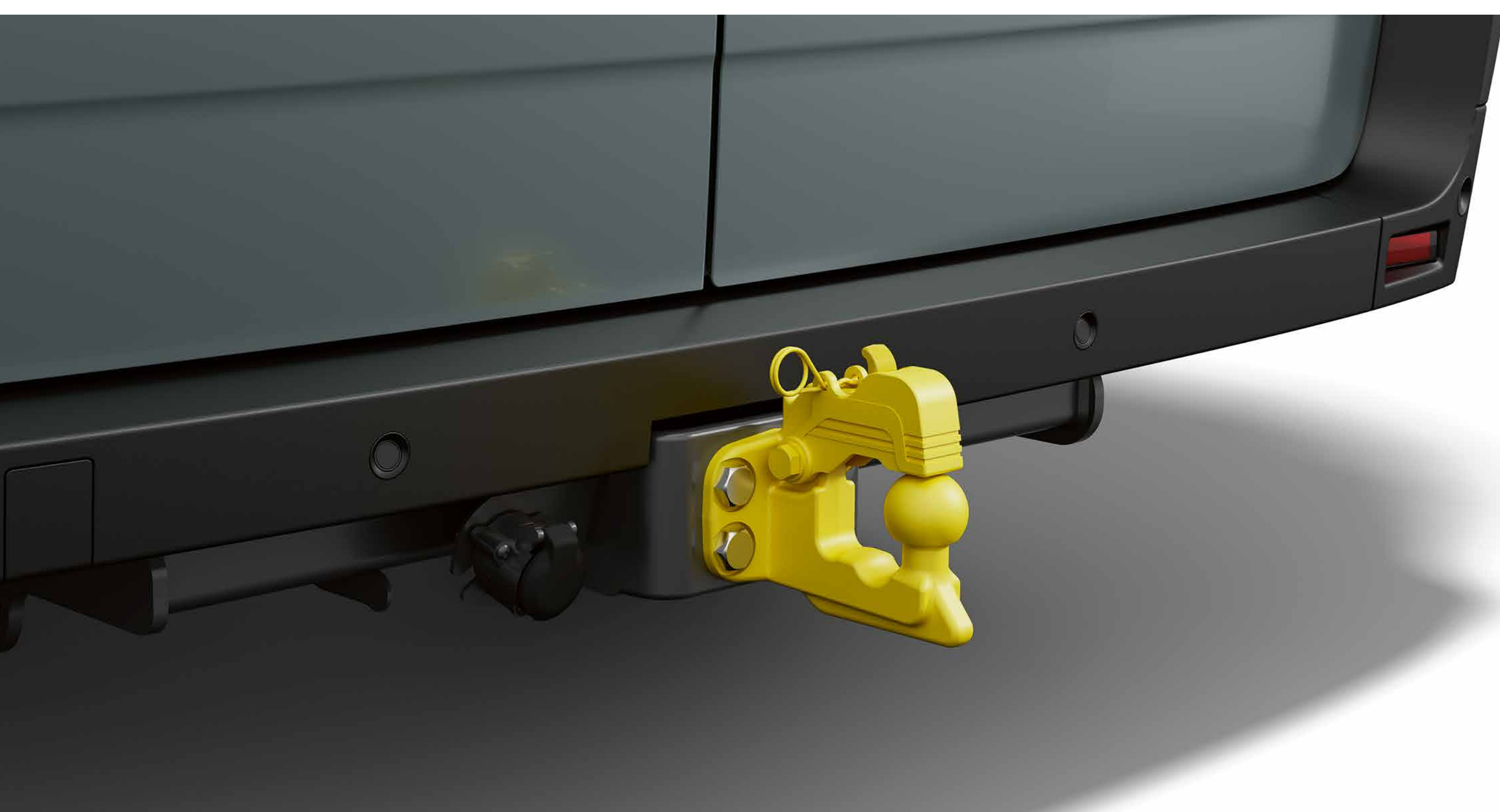
standardkobling og 4-hullers blandet anhængertræk

Standard trækkrogspakke med kugleled eller det 4-hullers blandede anhængertræk, er løsninger til at trække dit læs og opfylder de bedste sikkerhedsstandarder.