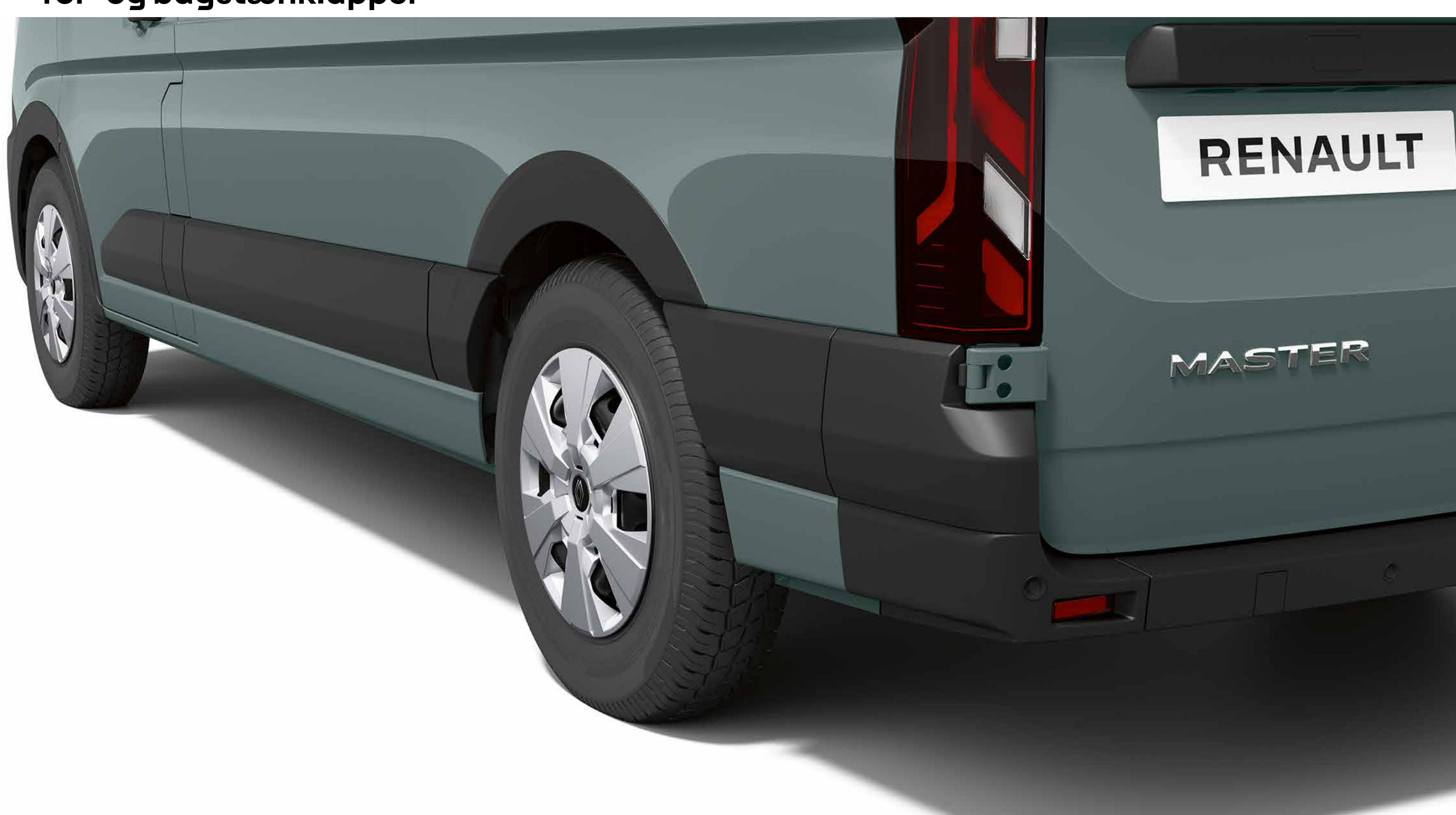
for- og baghjulskassebeskyttelse