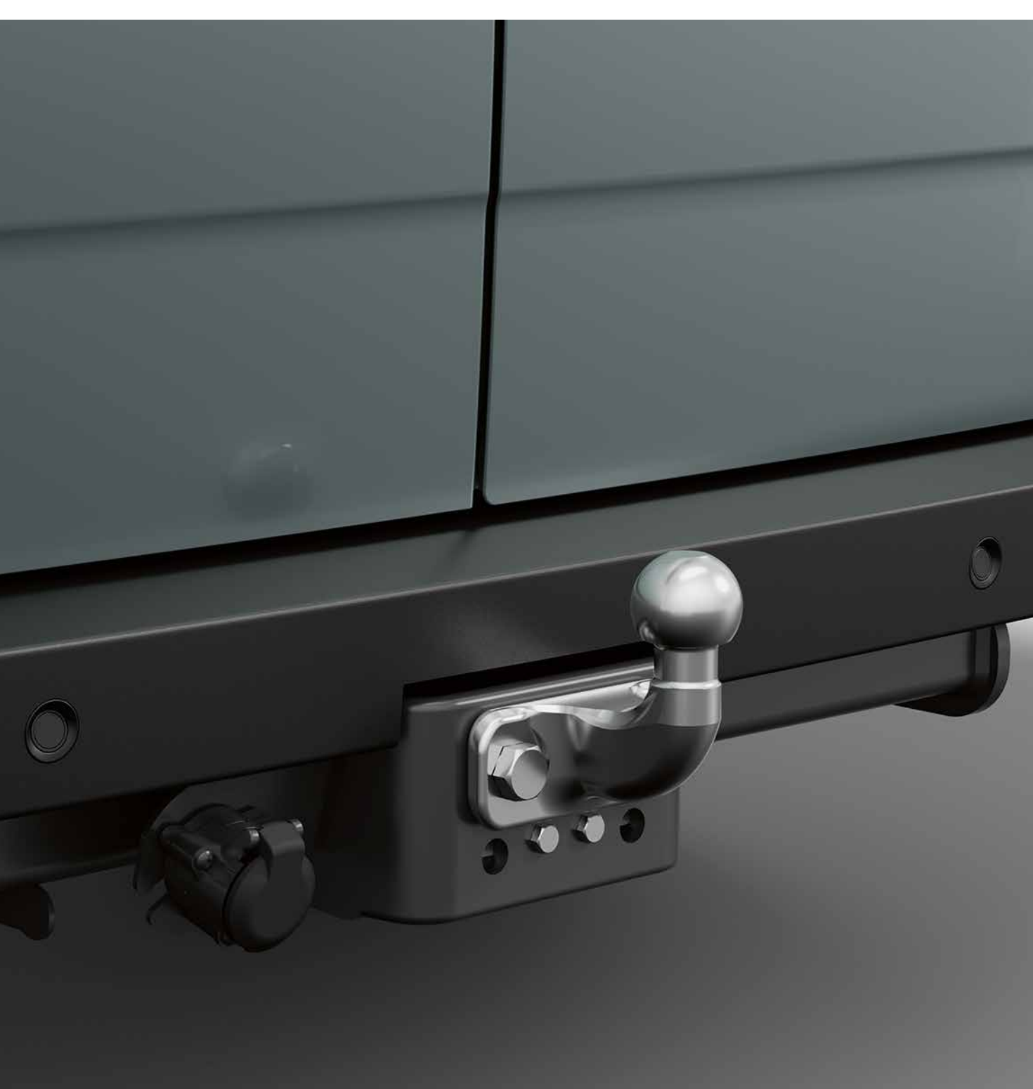
standard anhængertræk med kugleled

Monteret med kugleled eller trækstang er Renaults anhængerpakker 100 % kompatible med Renault Master og risikerer ikke at blive forvrænget. For maksimal fleksibilitet kan du vælge anhængerpakken med trækstang, så du kan trække en trailer med ring eller kugleled.