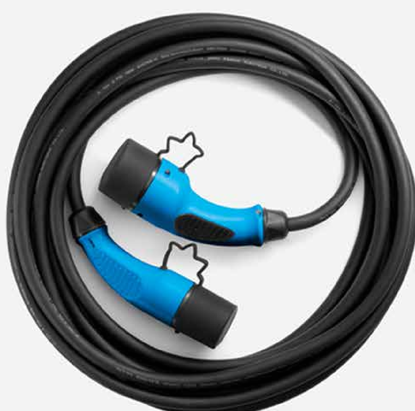
type 2 kabel til wallbox

Drag fordel af flexi-ladekablet, der kan bruges med et forstærket husholdningsstik (3 t 55 min for 50 km) og/eller husholdningskablet, der er tilpasset til standardstik (6 t 28 min for 50 km). Type 2-ladekablet bruges ved offentlige og private ladestationer til lange ture.