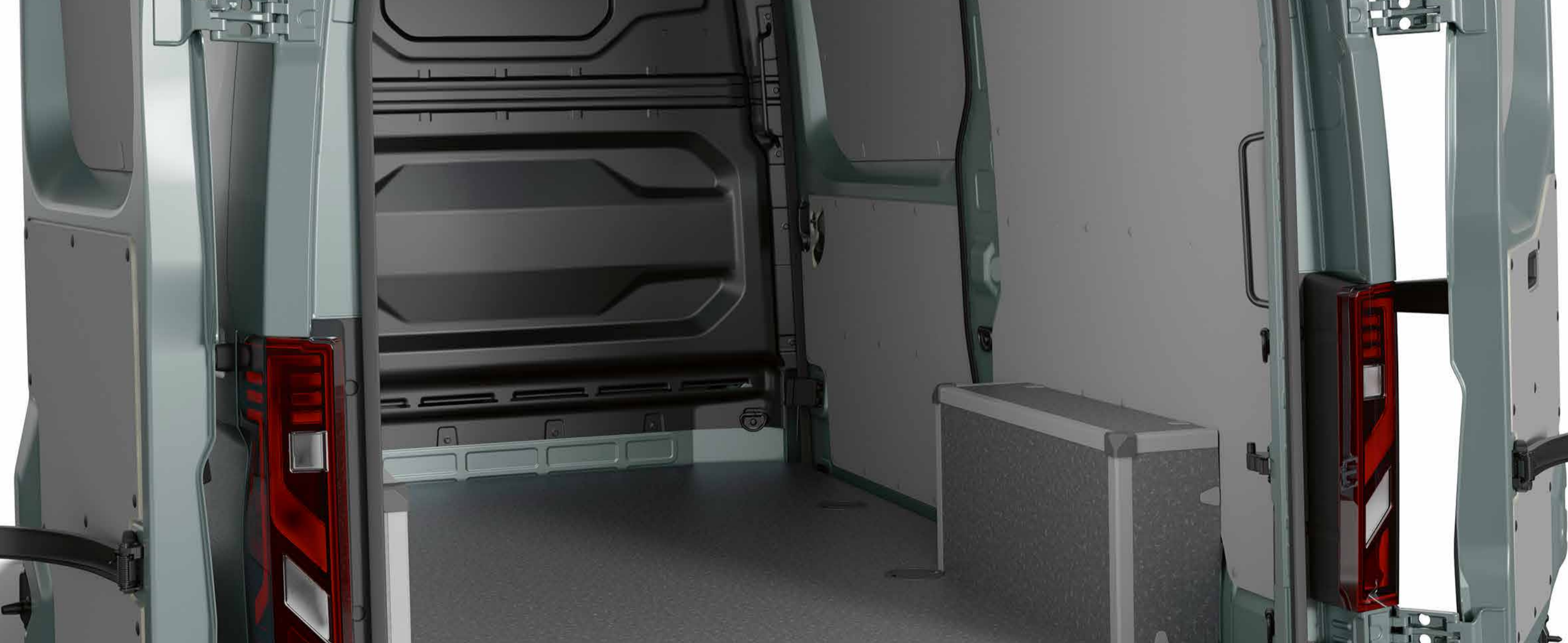
premium grå træbeklædning

Premium grå finish: Holdbar birketræsbeklædning med 12 mm skridsikkert gulv for forbedret holdbarhed. anbefales til intensiv brug, også med kemikalier eller i våde miljøer.